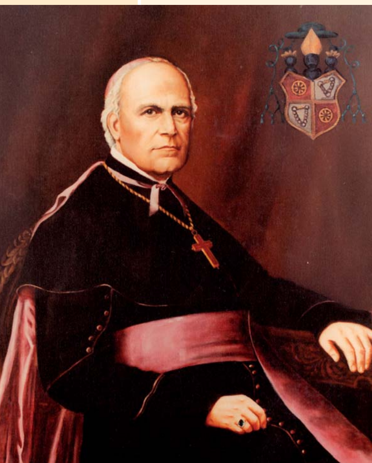
Im Jahr 1851 gründete Bischof Ketteler die Ordensgemeinschaft der Schwestern von der Göttlichen Vorsehung.