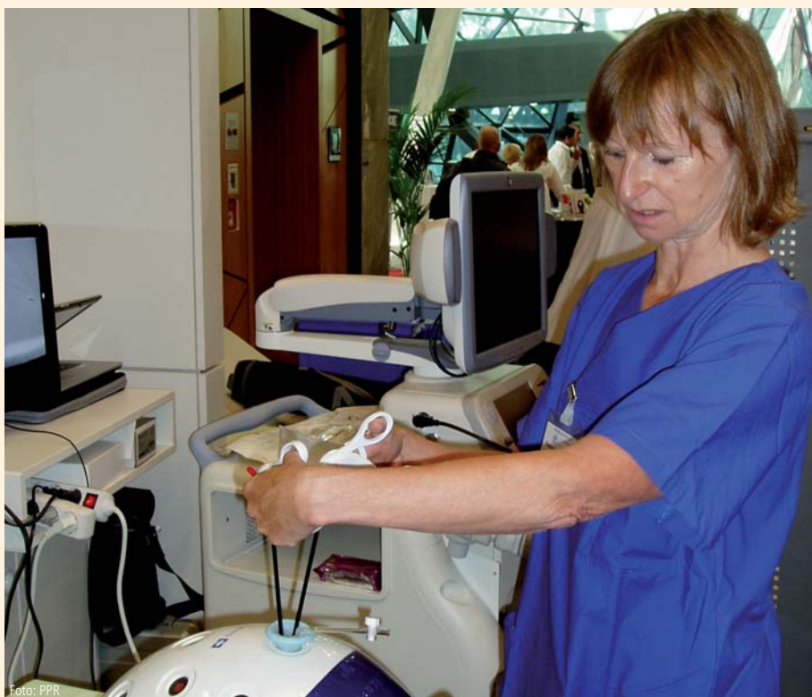
Der Simulator-Test beweist es: Minimal-invasives Operieren erfordert vor allem viel Erfahrung.

Zum 80. Jubiläum des Marienhospitals stifteten die Firmen Faust Consult und GDGmbH jeweils 500 Euro.