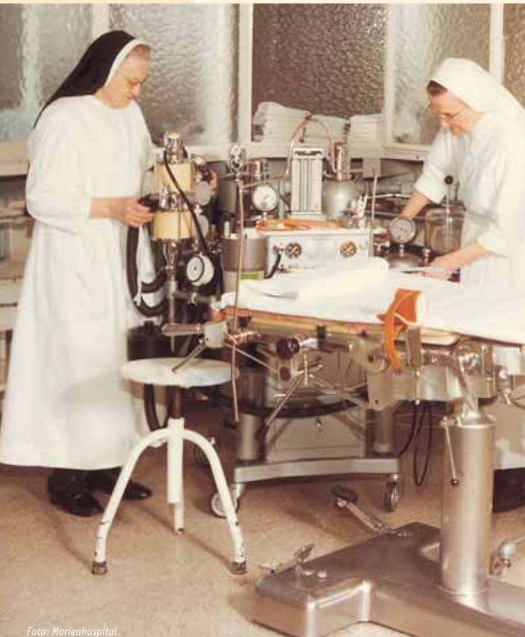
Modern für ihre Zeit war stets die technisch-medizinische Ausstattung des Marienhospitals.

Mit Penizillin hatten die Ärzte endlich etwas gegen Infektionen in der Hand